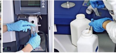
U izgradnju i opremanje savremene laboratorije za kontrolu goriva, kompanija SGS uložila je 2,2 miliona evra