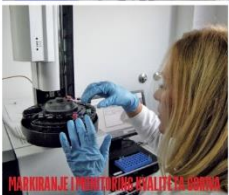
MARKIRANJE I MONITORING KVALITETA GORIVA