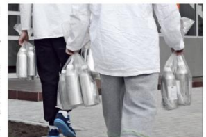
Rezultati mogu da se proverene Ako se utvrdi da gorivo ne zadovoljava propise, a prodavac tog goriva sumnja u izvršenu platu, on ima pravo da traži dodatnu proveru u drugoj laboratoriji. Zato se već pri uzimanju goriva na pumpi uzima više uzoraka, uključujući i one koji su namenjeni za dodatne proverene.

ste na benzinskim pumpama, a zbog pouzdanosti rezultata prisustvo markera se proverava i u laboratoriji. Laboratorijski uređaj daje precizne i pouzdane rezultate, koji se i kod nas i u svetu priznaju kao dokaz na sudu. Nalazi se u novoj zgradi kompanije SGS, predstavnik konzorcijuma, koja, po-