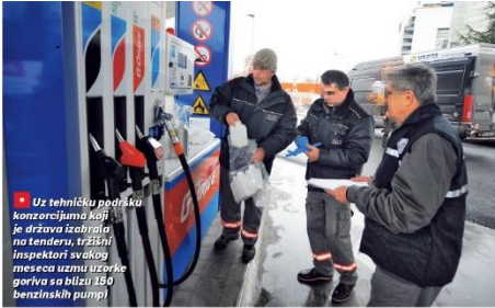
Uz tehničku podršku konzorcijuma koji je država izabrala na tenderu, tržišni inspektori svakog meseca uzmu uzorke goriva sa blizu 150 benzinskih pumpi